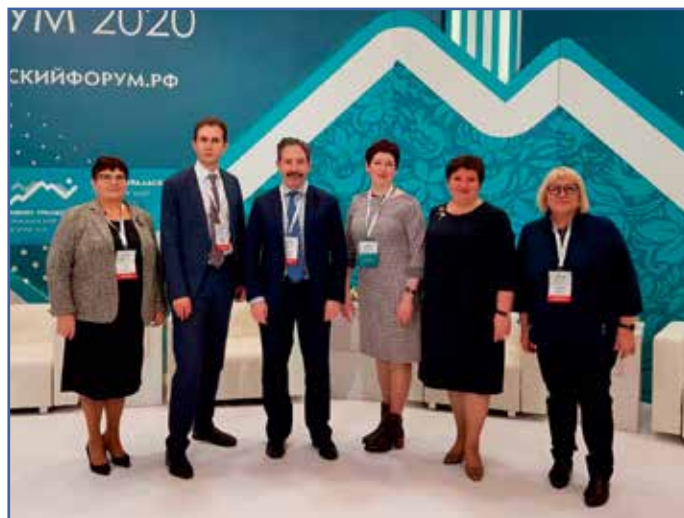
Гражданский форум, г. Челябинск, 2020 г.