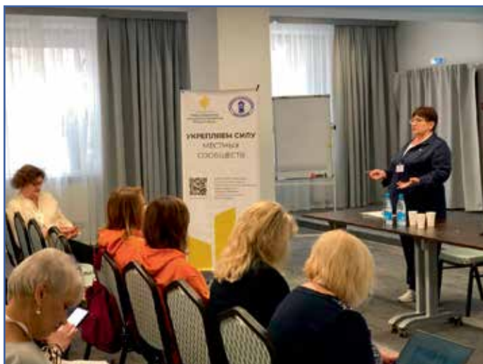
Школа муниципальных ресурсных центров для СО НКО Челябинской области