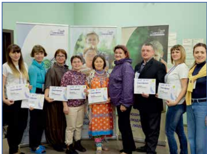
Победители конкурса «Культурная мозаика: партнерская сеть»